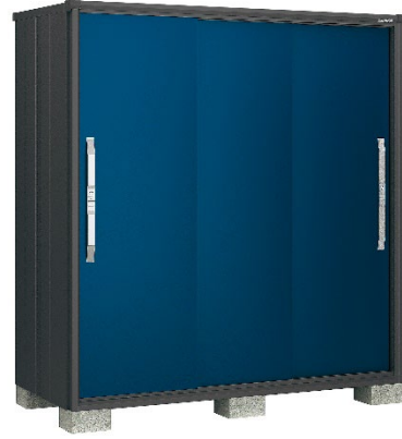
ディープオーシャンブルー(DO)