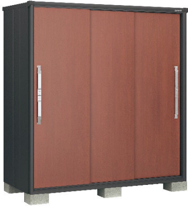
ウッディマロン(WM) ※ブラックエスモ限定色