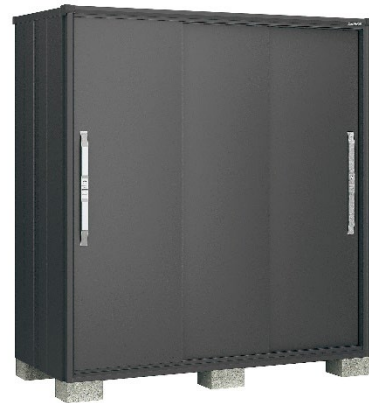
グラファイトメタリック(GM)