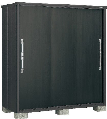
ウッディエボニー(WE)