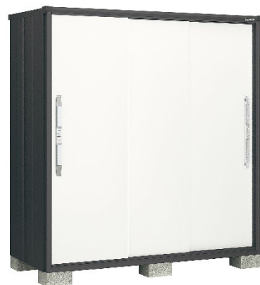
テイントホワイト(TW)