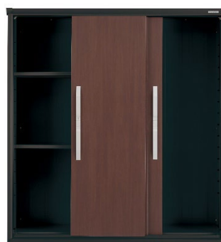
大きく開いて出し入れしやすい3枚扉