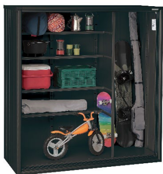
ブラック仕様の内装 ※ESF1807A-BK 収納イメージ

本体色はレザー調の塗装を施したマットな質感のブラック色で、シックな外観に仕上げました。内壁・天井・棚板・棚柱・床の内装もすべてブラック仕様です。大きく開いて出し入れしやすい3枚扉のカラーは、当社の鋼板印刷技術を生かした高級感のある木目調3色と住環境にマッチする落ち着いた3色の全6色からお選びいただけます。扉色「ウッディマロン（WM）」はブラックエスモ限定色です。