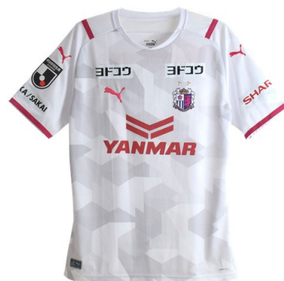
ホーム ユニフォーム