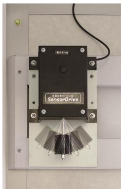
(1)センサードライブ