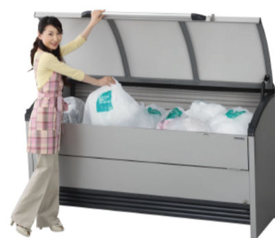
大きな取手と全開できる投入口