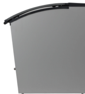
前傾斜の正面パネル