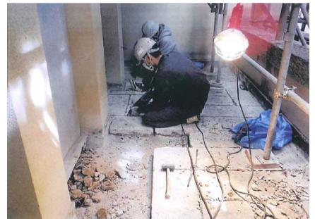
3階和室ベランダでの大谷石敷石の解体作業