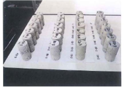
耐久性を高めるため材料や配合比率を変えた飾り石サンプル