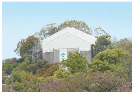
<工事中の当館全景> (足場と素屋根のテントに覆われています)