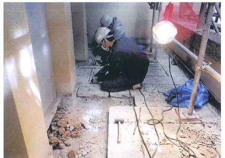
3階和室ベランダでの大谷石敷石の解体作業