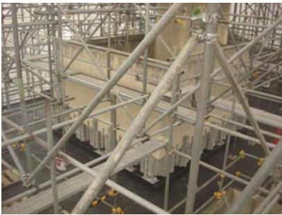
トラス構造で補強されている足場