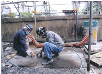
4階屋上での防水層の除去作業