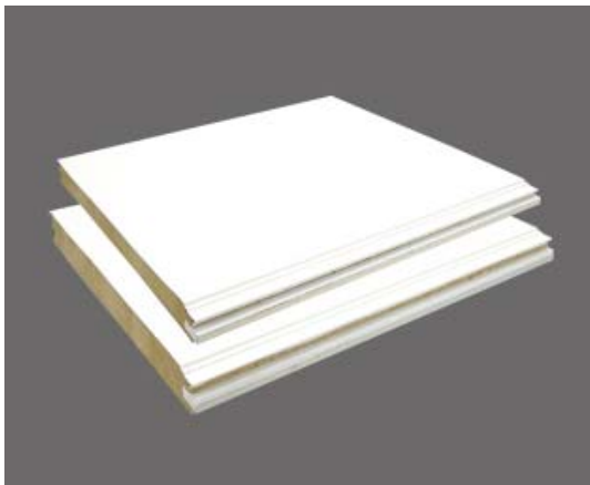
(ヨド耐火パネル グランウォール Hyper)